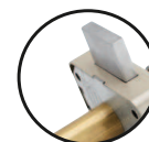
Foncet vissé démontable

Pour une porte de 45 mm, utiliser un cylindre de 30x60 mm